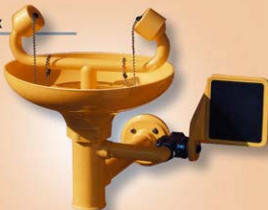
LAVA-OJOS DE EMERGENCIA MONTAJE MURAL