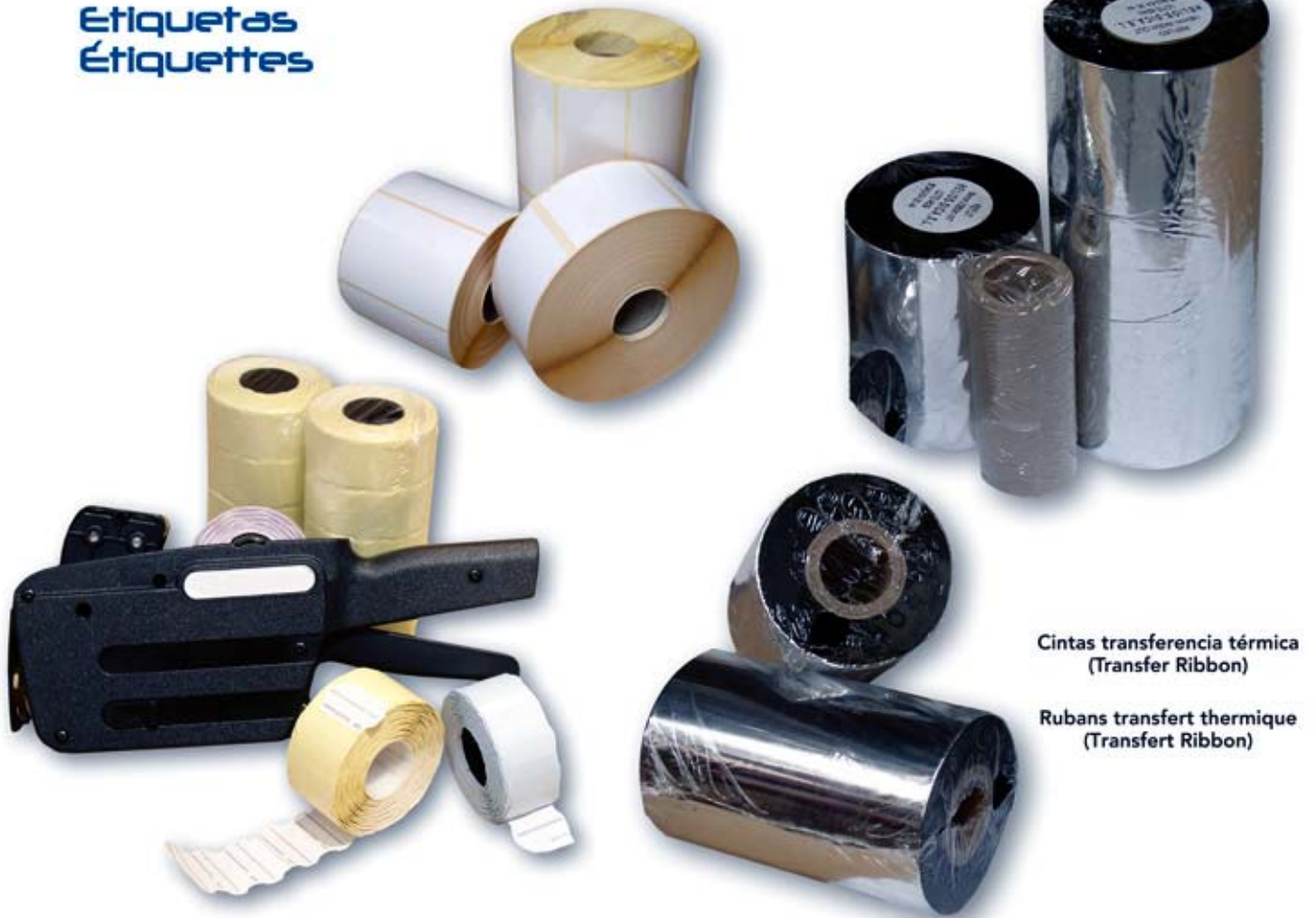
Cintas transferencia térmica (Transfer Ribbon)